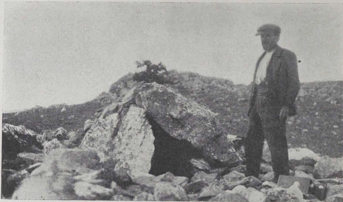
Fig. 80. — Llansà. Sepulcre I de Puig Asquer